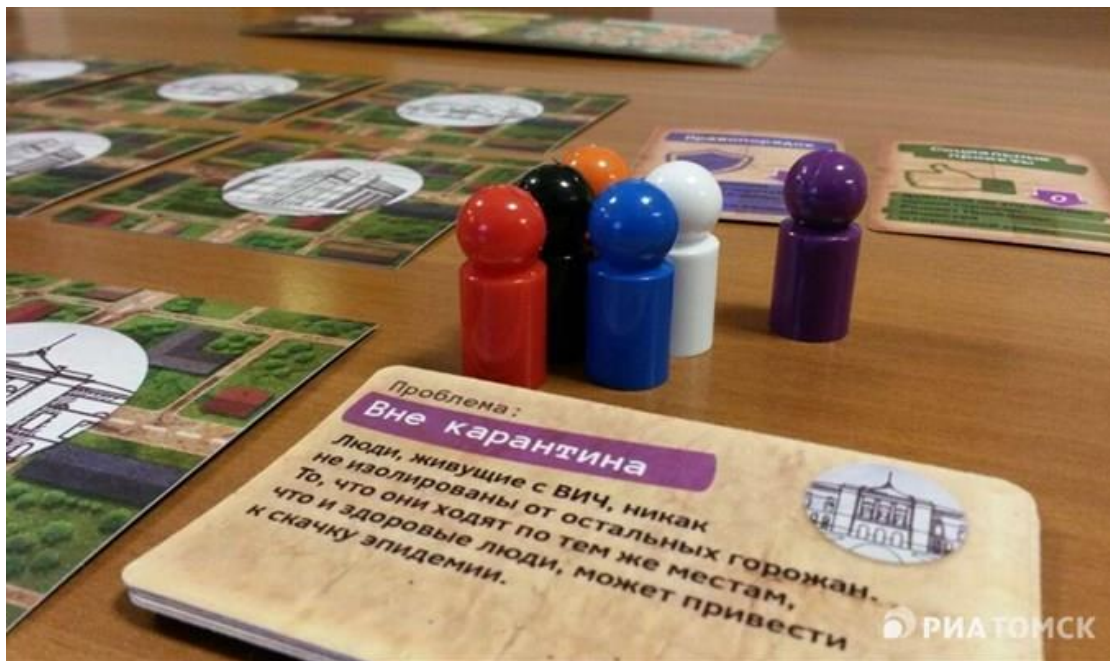
Настольная игра «Проект С.В.И.П.Е.Р. Лаборатория»