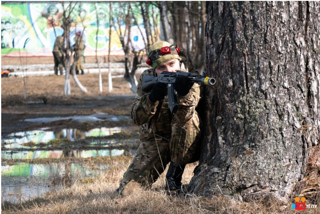
Командно-тактическая игра «Штурм», 2021 год.